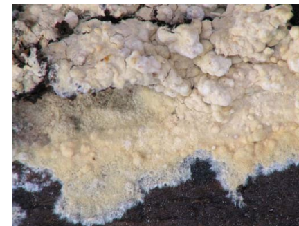
Hyménophore (partie fertile produisant les spores) d'un Asterostroma